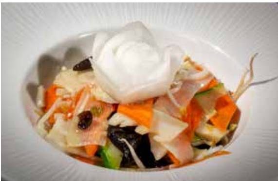
176 / VERDURE SALTATE 🌿