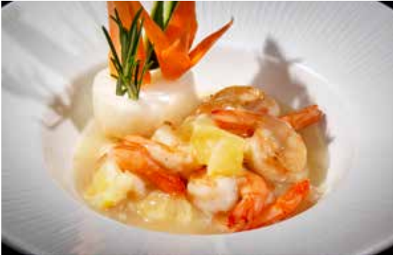
161 / GAMBERI* IN SALSA LIMONE