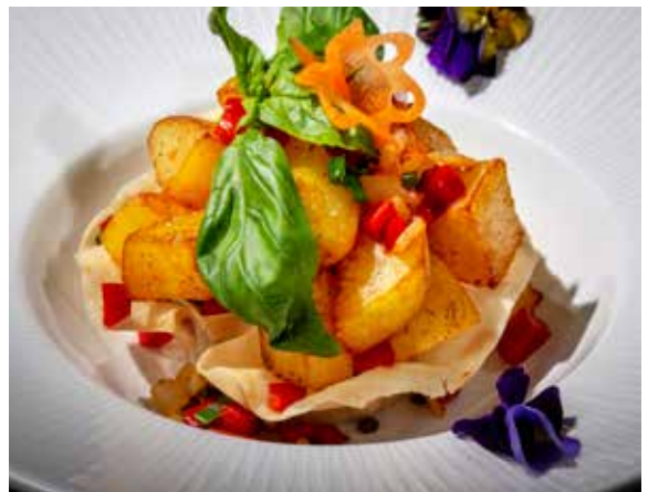
177 / PATATE SALE E PEPE 🌿