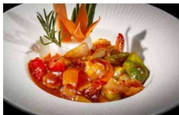
158 / GAMBERI* PICCANTI 🔥