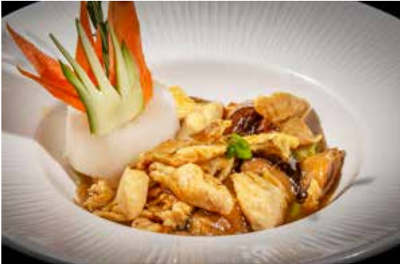
147 / POLLO* CON BAMBÙ, FUNGHI E SCAGLIE DI MANDORLE