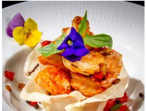
162 / GAMBERI* SALE E PEPE