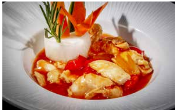
150 / POLLO* CON SALSA AGRODOLCE