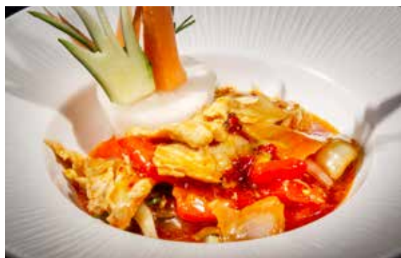
154 / MANZO* PICCANTE 🔥