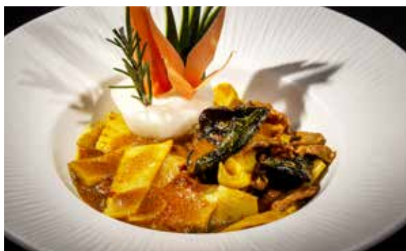
155 / MANZO* AL CURRY