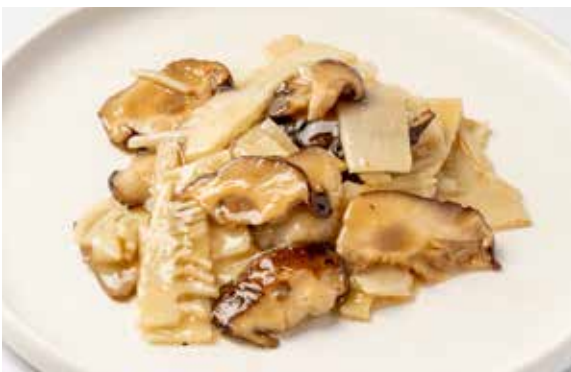
225 / FUNGHI E BAMBÙ SALTATI 🌿