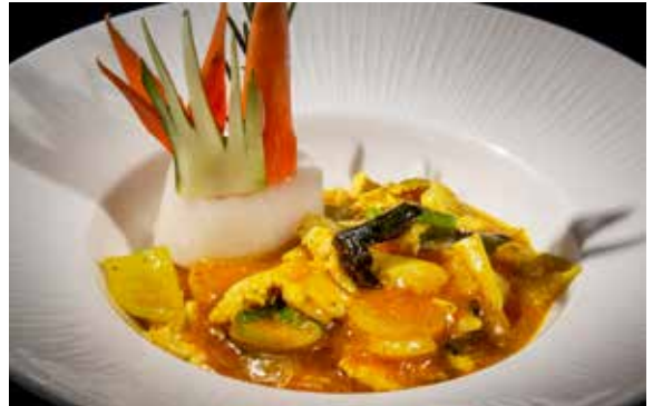
148 / POLLO* AL CURRY