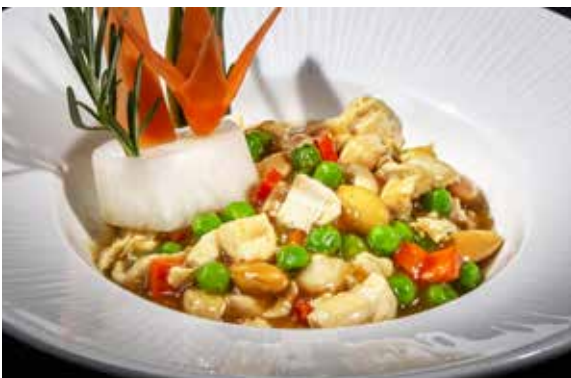
151 / POLLO* ALLE MANDORLE