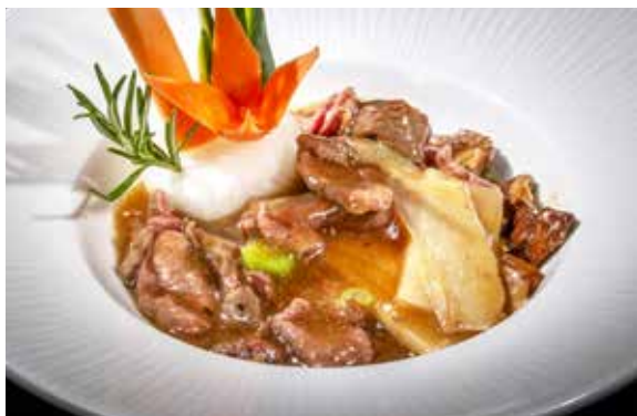
153 / MANZO* SALTATO CON FUNGHI E BAMBÙ