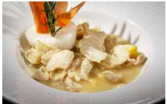
152 / POLLO* AL LIMONE