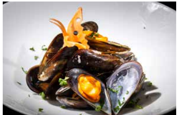
163 / COZZE SALTATE