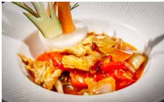
154 / MANZO* PICCANTE 🔥