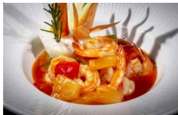
160 / GAMBERI* IN SALSA AGRODOLCE