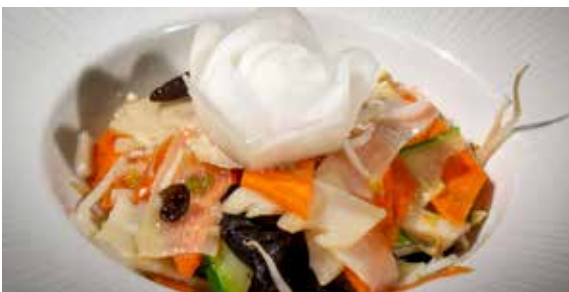
176 / VERDURE SALTATE 🌿