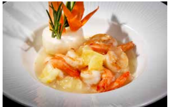
161 / GAMBERI* IN SALSA LIMONE