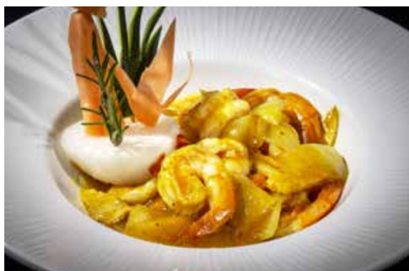
159 / GAMBERI* AL CURRY