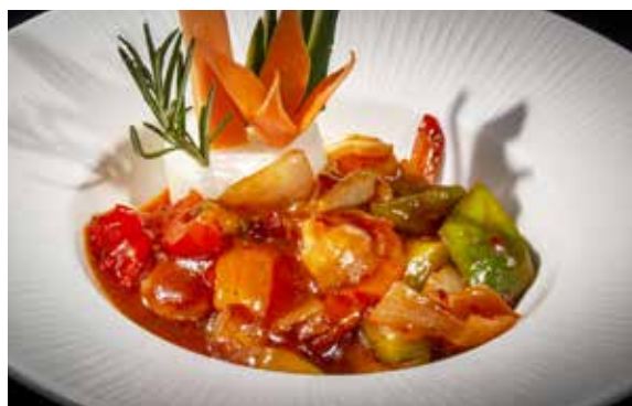
158 / GAMBERI* PICCANTI 🔥