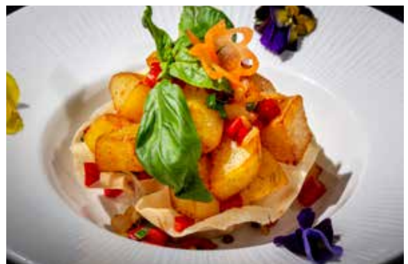
177 / PATATE SALE E PEPE 🌿