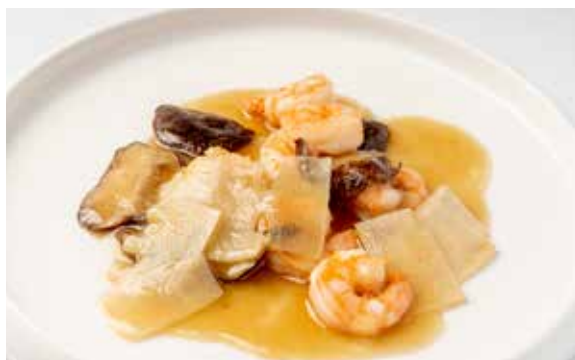
156 / GAMBERI* CON BAMBÙ E FUNGHI