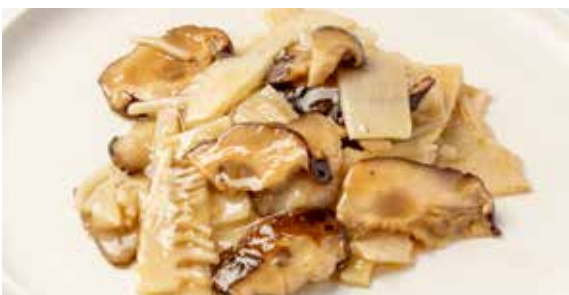
225 / FUNGHI E BAMBÙ SALTATI 🌿