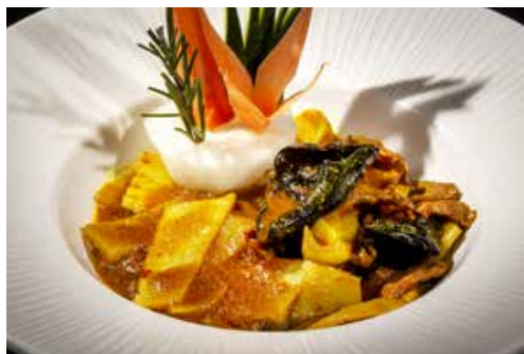
155 / MANZO* AL CURRY