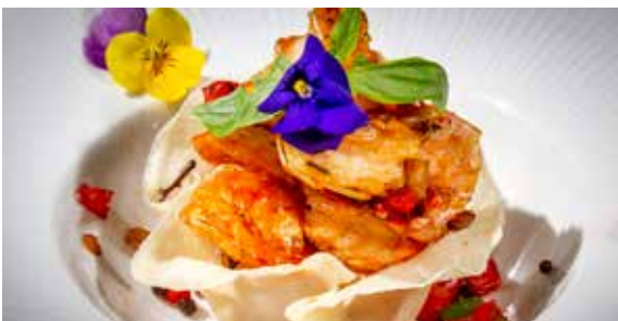
162 / GAMBERI* SALE E PEPE