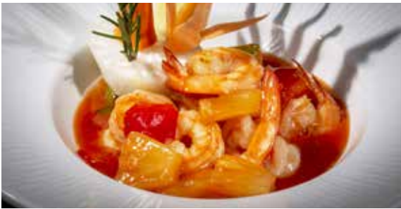
160 / GAMBERI* IN SALSA AGRODOLCE