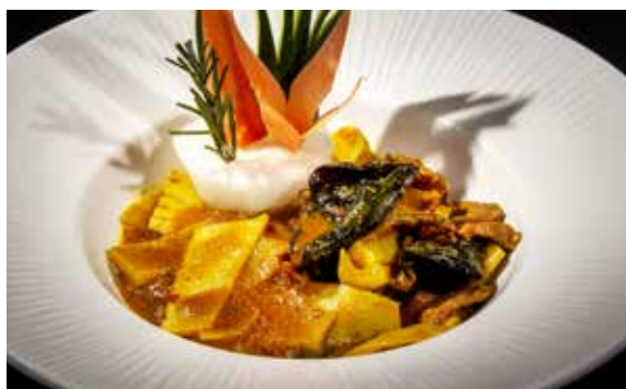
155 / MANZO* AL CURRY