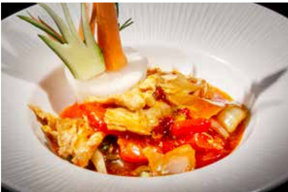
149 / POLLO* PICCANTE 🔥